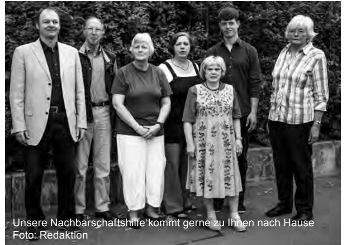
Unsere Nachbarschaftshilfe kommt gerne zu Ihnen nach Hause