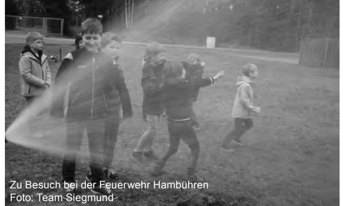
Zu Besuch bei der Feuerwehr Hambühren