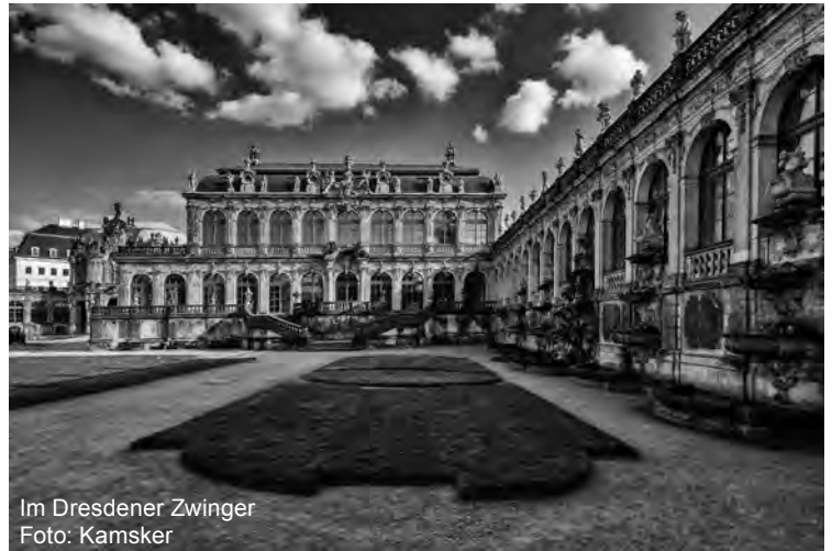
Im Dresdener Zwinger

Geistliche Höhepunkte unseres Dresdenwochenendes waren der Besuch der Kreuzkirche zur Vesper mit dem berühmten Kreuzchor (ein Knabenchor) und der Gottesdienst am Sonntag in der Frauenkirche mit zwei Taufen. In diesen Kirchengebäuden, die vom Willen zur Veränderung, Neu-