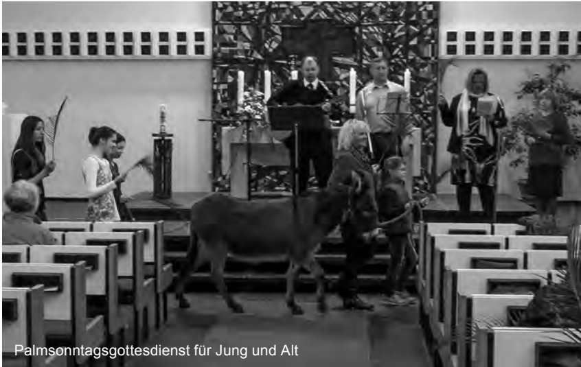
Palmsonntagsgottesdienst für Jung und Alt