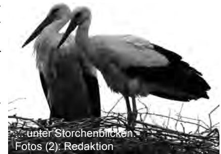
... unter Storchenaugen.