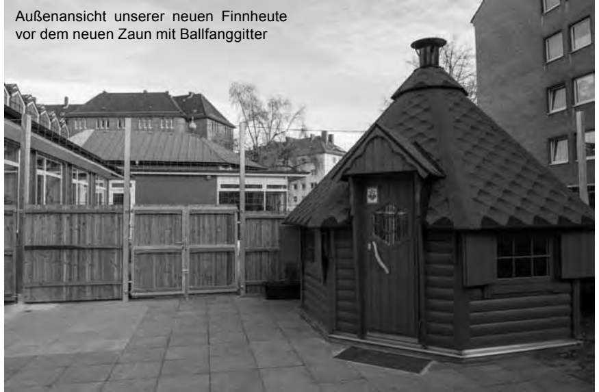
Außenansicht unserer neuen Finnheute vor dem neuen Zaun mit Ballfanggitter